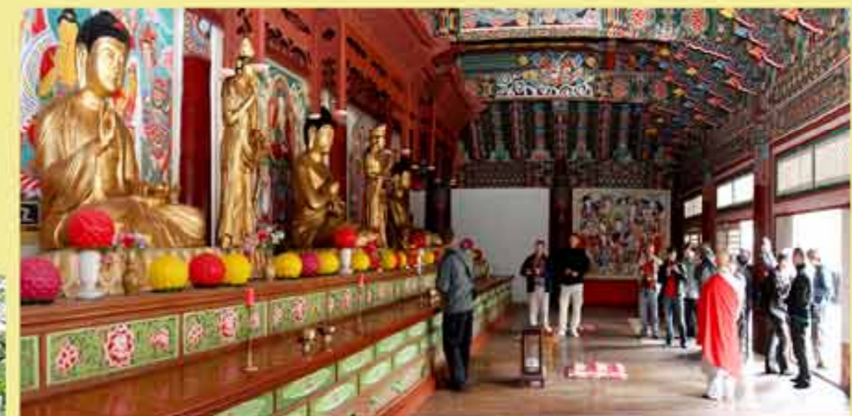
Туристы из разных стран мира.

Начальник управления Госинтуризма КНДР Ким Ён Ир.