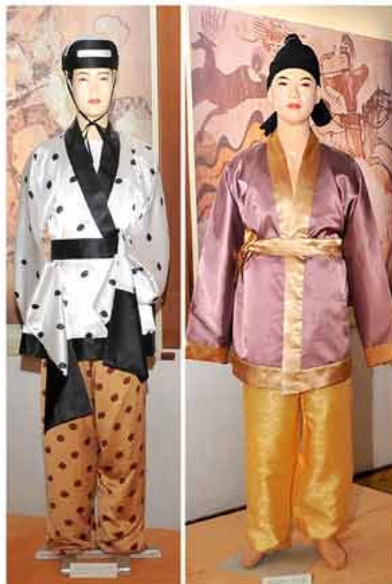
Одежда танцовщика (слева) и одежда охотника (справа).

В сентябре прошлого года в Пхеньянском этнографическом парке проходила Выставка национальных одежд корейцев.