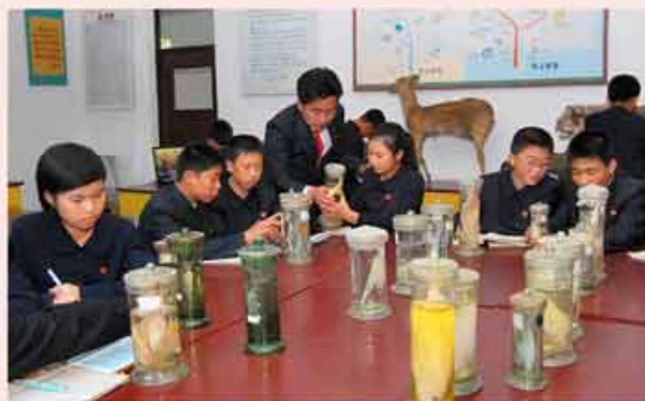
С большой надеждой и стремлением школьники усердно занимаются учебой.