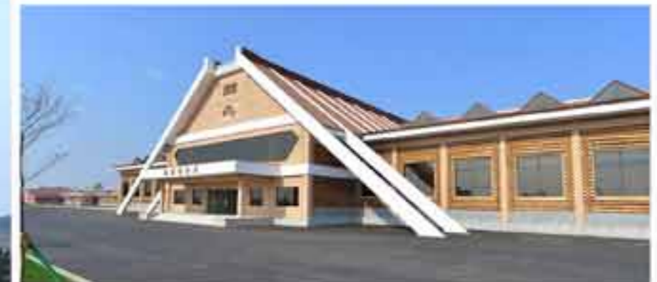
Закрытый тренировочный зал.