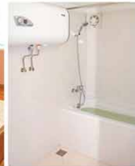
Часть интерьера дома.