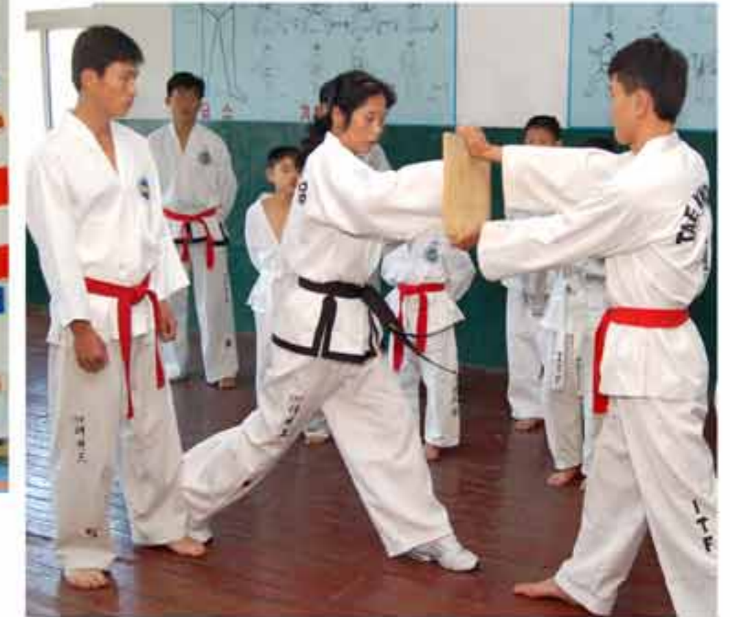
В тренировочном зале.

В августе 101 года чучхе (2012) в Талине, столице Эстонии, был V Чемпионат мира тхэквондоистов пожилого возраста. На нем 51-летняя кореянка получила две золотые медали и приз за технику.