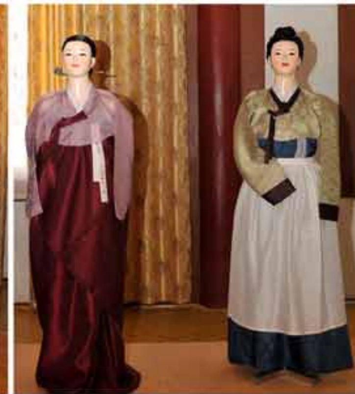
Женские одежды разных времен.