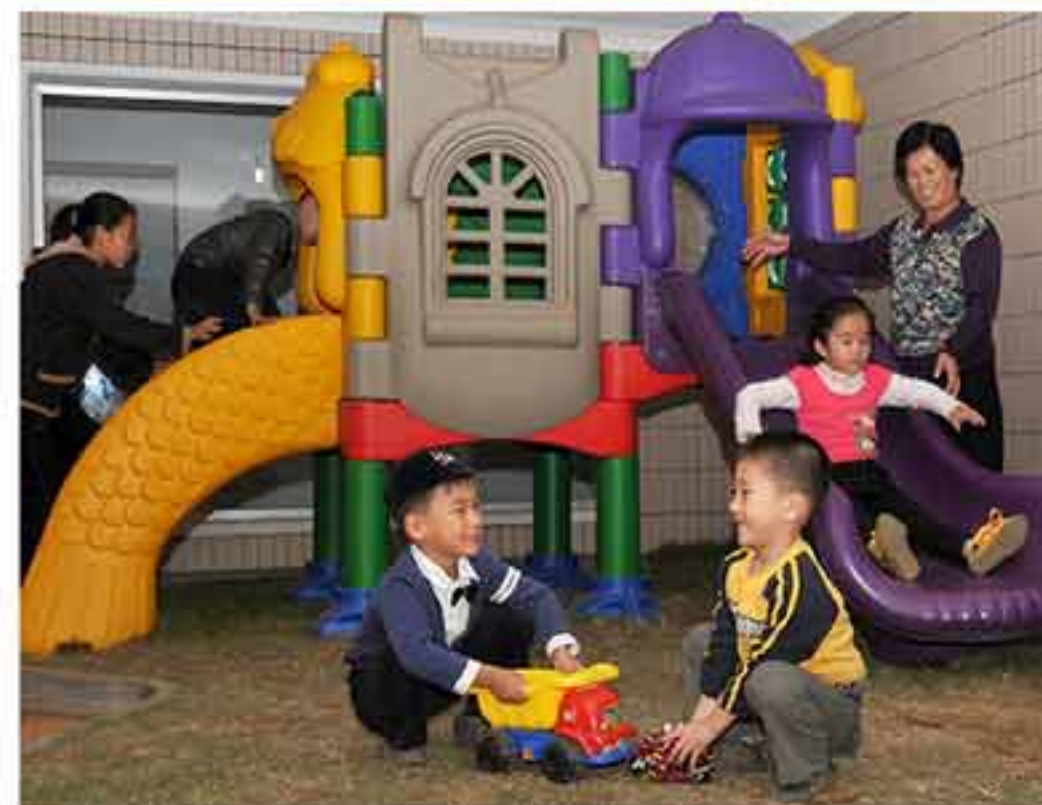
Места для отдыха в домах.

Не только они, но и все люди страны радуются этим новосельем. В их новоселье они видят будущее Родины, которая благодаря политике Трудовой партии и государства по отдаче приоритета науке, способным кадрам станет непрерывно развиваться и процветать.