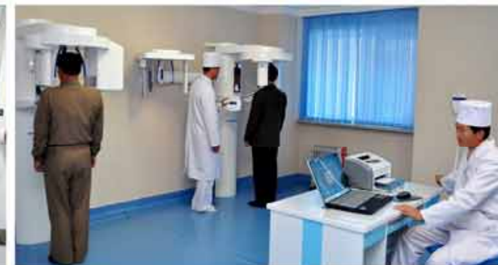
Комната рентгеновской съемки зубов.