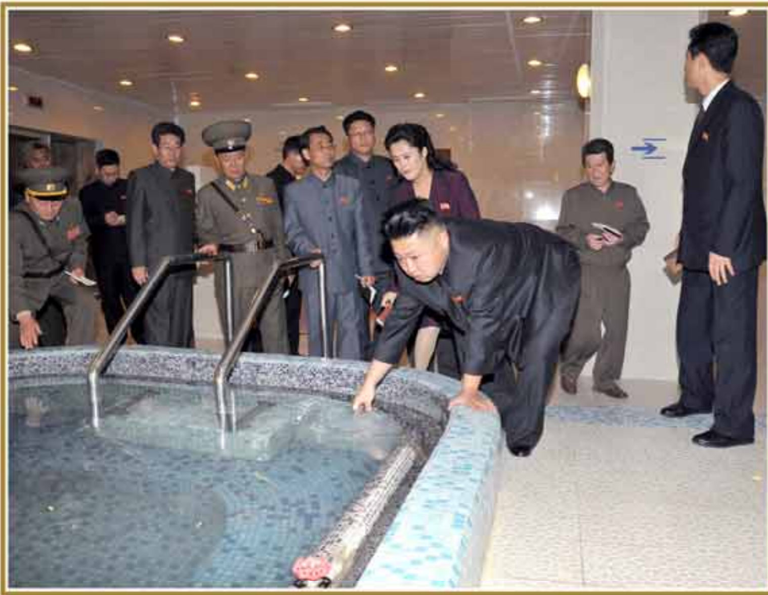
Ким Чен Ын – в Водно-оздоровительном комплексе «Рюгёнвон». Ноябрь 101 года чучхе (2012).