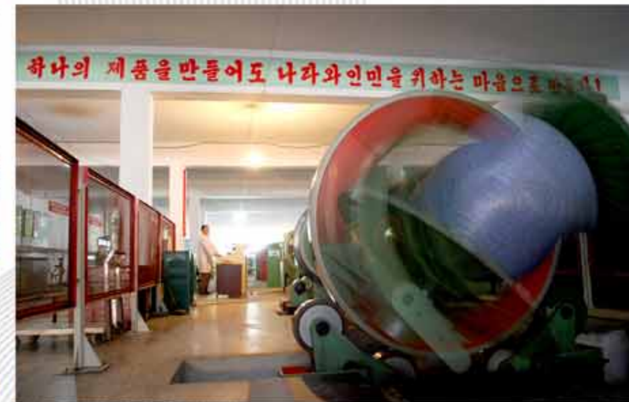
На заводе мощно раздувается пламя движения за техническое новаторство для выпуска кабелей разного назначения.