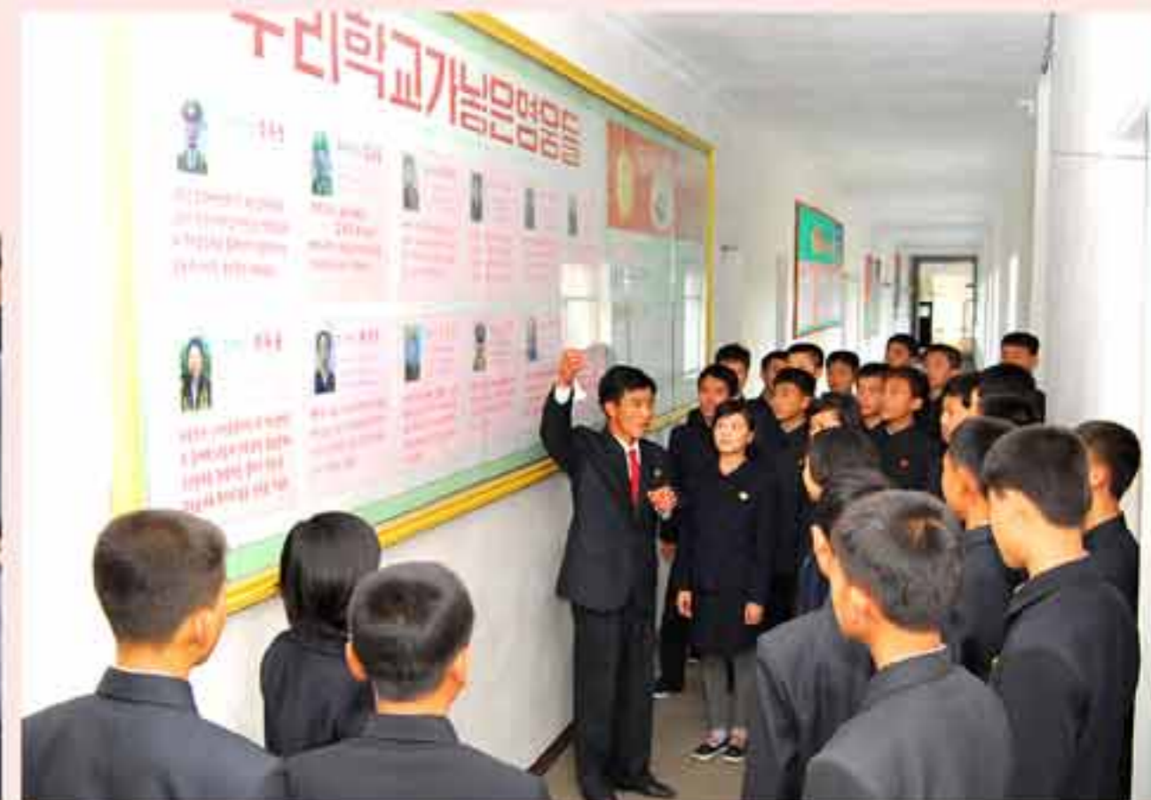
Воспитывают школьников в духе патриотизма героев.