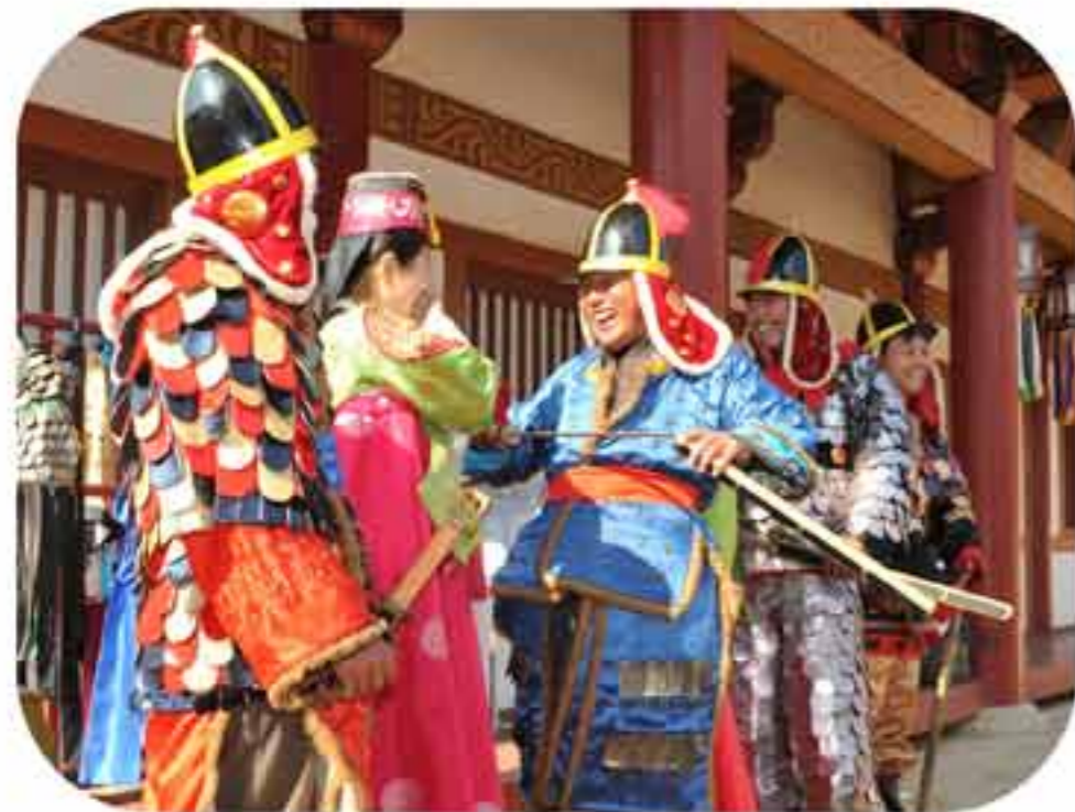
Посетители осматривают Выставку.