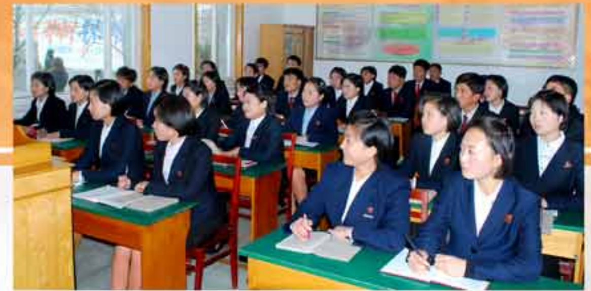
В училище теоретическое обучение тесно сочетается с практикой.