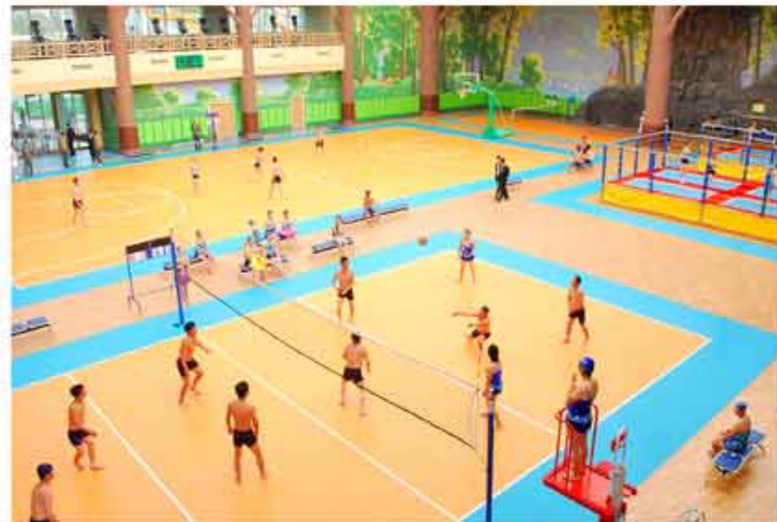
В спортивном павильоне установлены разные тренажеры.