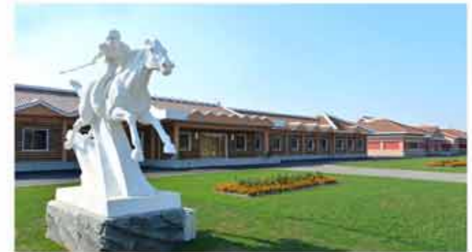
Дом распространения знаний о конном спорте.