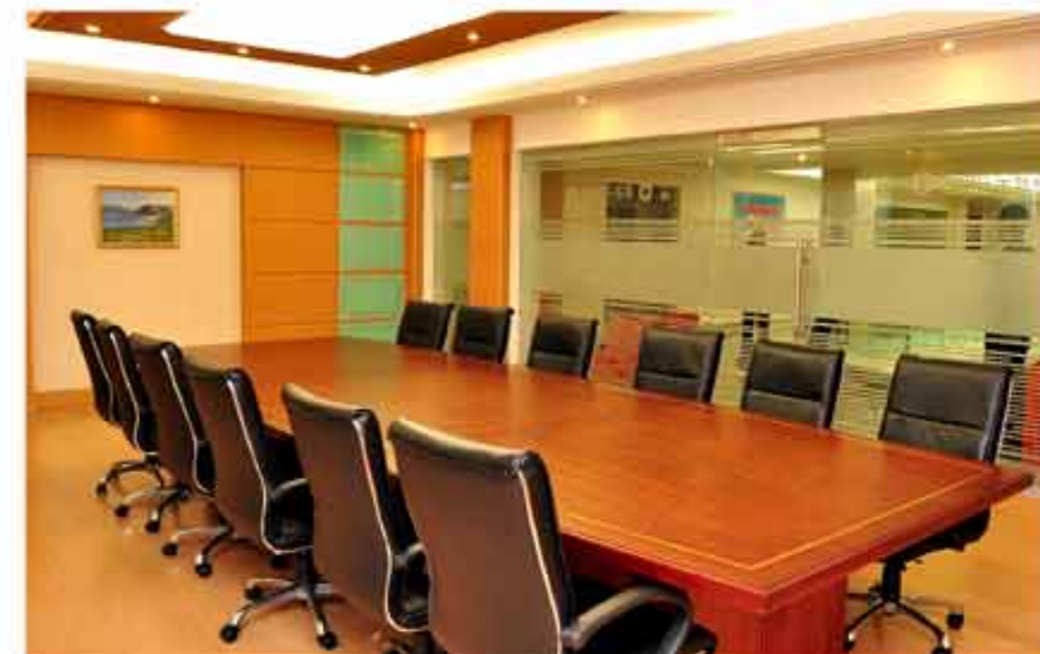
Комната для беседы.