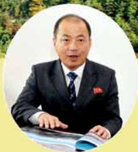
Ким Ён Ир.