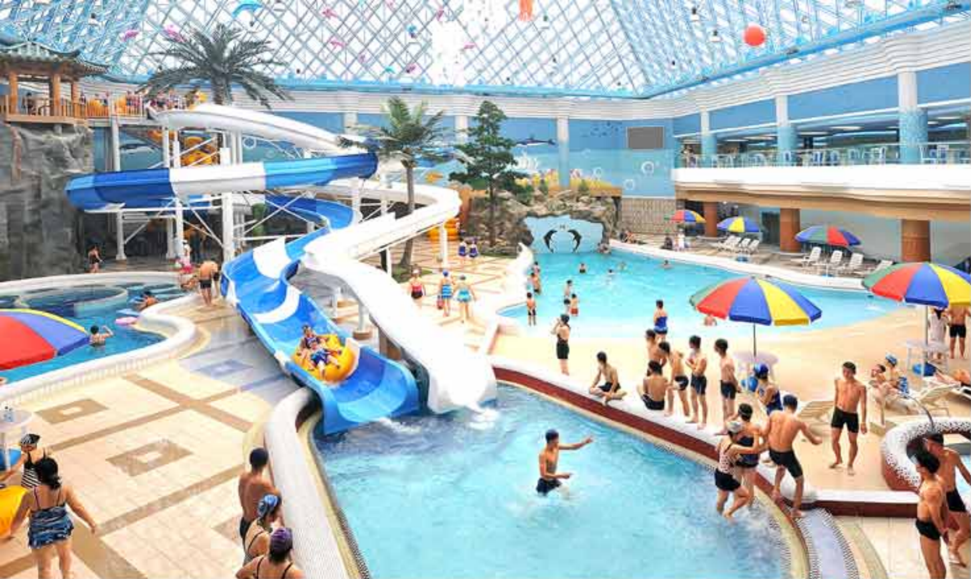
В аквапарке люди проводят веселое время отдыха.