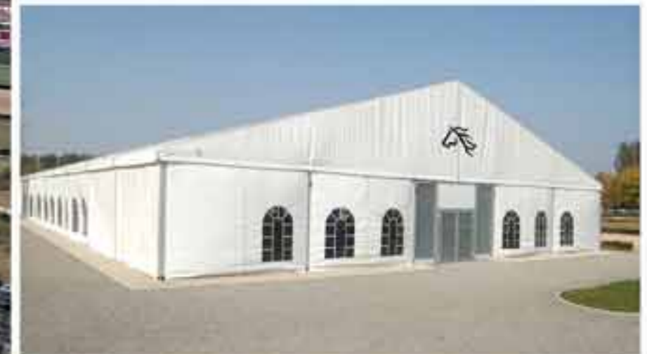
В палатке – место для отдыха.