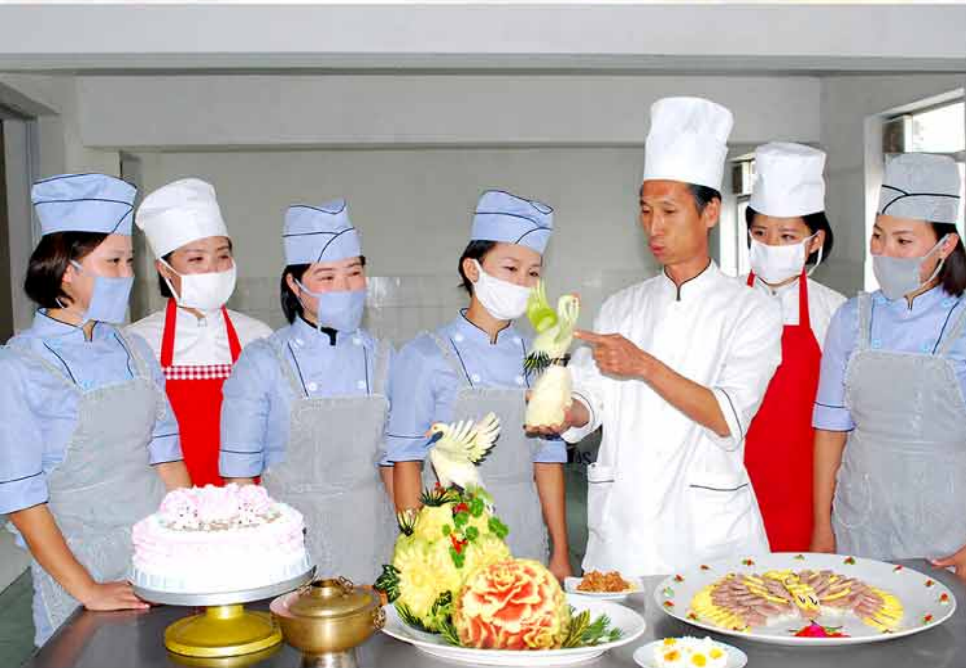
Большое внимание уделяется кулинарной практике.