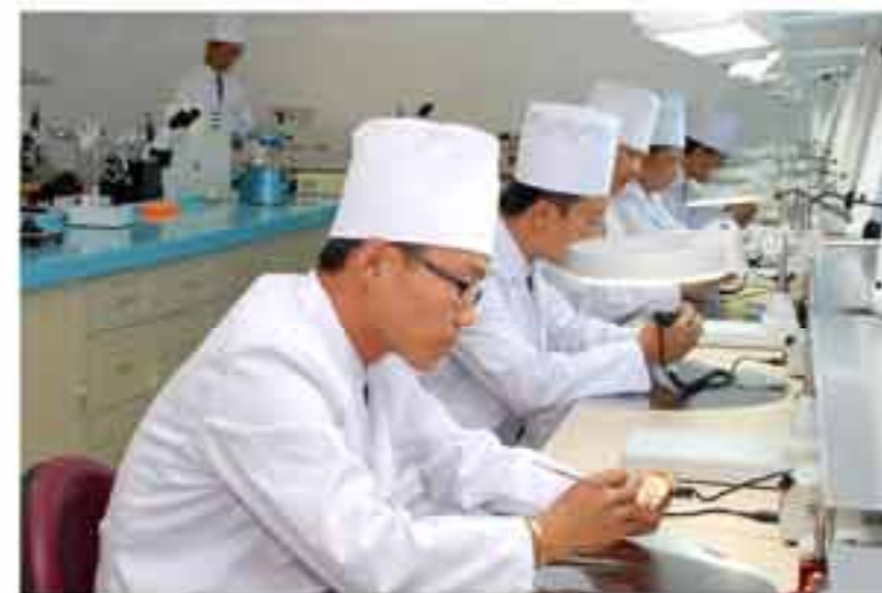
Отделение зубного протеза.

В кабинетах для лечения детей, устроенных в соответствии с психологией детей, юные пациенты чувствуют себя спо-