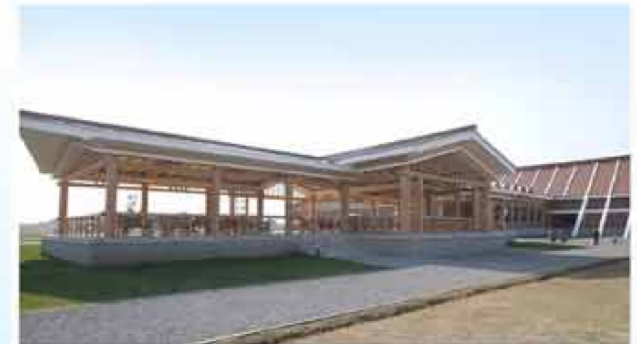
Трибуна для зрителей.