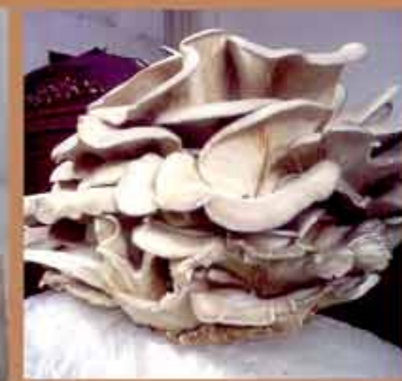
Грибы, разведенные Мун Хе Сун.